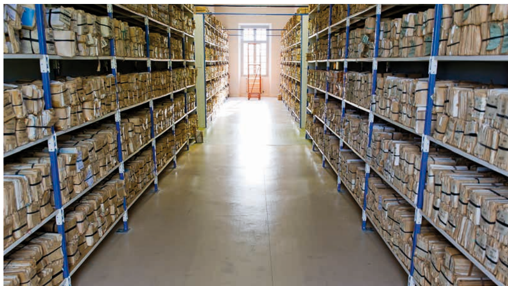
Magasin du fonds français.

Les choses pourraient être simples. Il suffirait de nous fier aux intitulés. La désignation « Centre des archives du personnel militaire » serait donc une évidence en soi. Dans la constellation du Service historique de la Défense (SHD), le CAPM de Pau serait en quelque sorte le pendant du Centre des archives de l'Armement et du personnel civil (CAAPC) de Châtelleraut. Les civils ayant travaillé pour le ministère de la Défense d'un côté, les militaires dépendant de ce même ministère de l'autre, c'est entendu. Mais comme nous